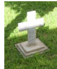
bis zum Tod