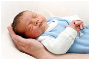
Von der Geburt